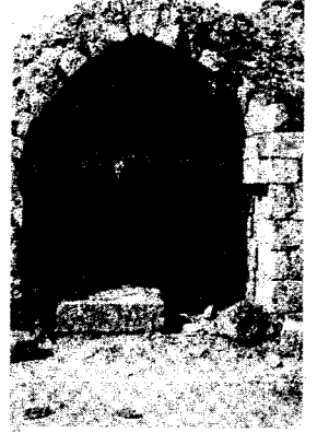
An arch in Tughlakabad, Delhi

The city of Dehli covers a wide area and has a large population ... The rampart round the city is without parallel. The breadth of its wall is eleven cubits; and inside it are houses for the night sentry and gatekeepers. Inside the ramparts, there are store-houses for storing edibles, magazines, ammunition, ballistas and siege machines. The grains that are stored (in these ramparts) can last for a long time, without rotting ... In the interior of the rampart, horseman as well as infantrymen move from one end of the city to another. The rampart is pierced through by windows which open on the side of the city, and it is through these windows that light enters inside. The lower part of the rampart is built of stone; the upper part of bricks. It has many towers close to one another. There are twenty eight gates in this city which are called darwaza, and of these, the Budaun darwaza is the greatest; inside the Mandwi darwaza there is