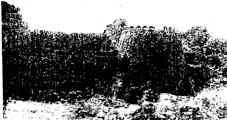
Part of the fortification wall of the settlement

a grain market; adjacent to the Gul darwaza there is an orchard ... It (the city of Dehli) has a fine cemetery in which graves have domes over them, and those that do not have a dome, have an arch, for sure. In the cemetery they sow flowers such as tuberose, jasmine, wild rose, etc.;